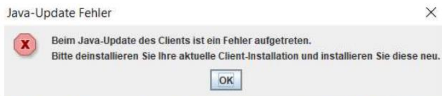
Abbildung 2: Hinweismeldung bei fehlgeschlagenem Java-Update des Clients.

Sollte obige Fehlermeldung angezeigt und die Schaltfläche OK betätigt werden, wird die Aktualisierung des DSS fortgesetzt. Hierbei ist zu beachten, dass zwar die Anwendungsversion und die Datenbank auf die Version F4.0.134 angehoben wurden, die Java-Version des DSS jedoch nicht aktualisiert wurde. Bei Auftreten dieses Fehlerbildes sollte der Support kontaktiert werden.