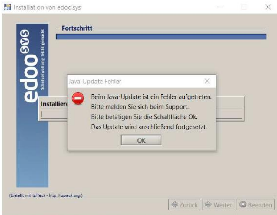
Abbildung 1: Hinweismeldung bei fehlgeschlagenem Java-Update des DSS.

Sollte während des Java-Updates des DSS oder des Clients ein Fehler auftreten, wird je nach aktualisierter Komponente eine der folgenden Hinweismeldungen angezeigt: